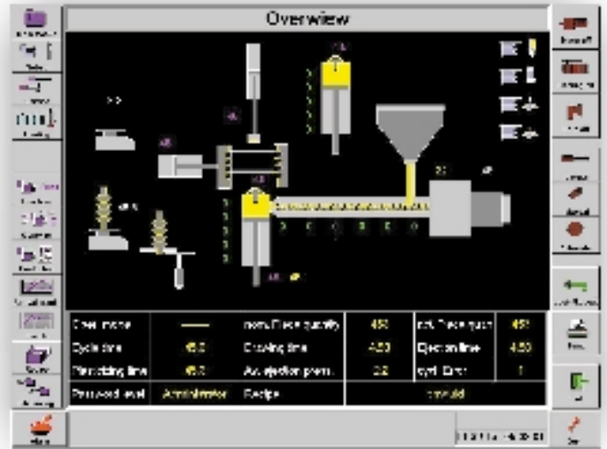
Der Bediener berührt auf dem Maschinenübersichtsbild mit dem Finger ein Maschinenteil und gelangt so auf die entsprechende Bedienseite

Mit Touchscreens ausgestattete Industrie-PCs versprechen eine komfortable Maschinenbedienung ohne komplizierte Menüführung. Die direkte Anwahl von Funktionen über Symbole hilft, Fehlbedienungen auszuschließen. Der Kasseler Anbieter PMA hat mit der Bedienterminalreihe IQT solch ein System im Programm.