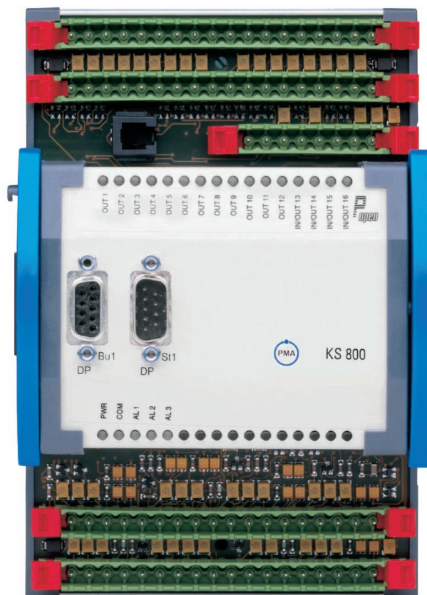
Bild 1: KS 800 Multitemperatur-Regler / Fig.1: KS 800 multi-Temperature controller

Especially with 3-layer foamed pipe extrusion, exact temperature control is a prime factor for the product's properties. The KS 800 controllers ensure the necessary precision and stability for all the heating and heating/cooling zones. For this, the control parameters must be matched precisely to the loop conditions. At the push of a button, the standard self-tuning function of the KS 800 determines the optimum settings, e.g. after a step change (start-up), whereby even the mutual effects of neighboring heating zones of mould and extruder are taken into account.